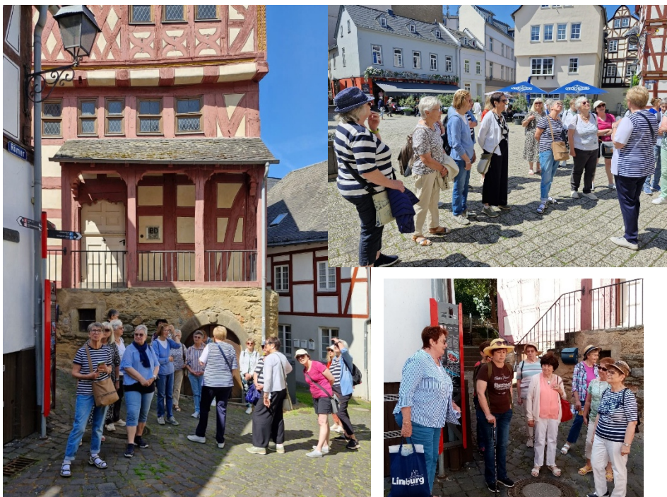
Nach Limburg führte im Juni der Jahres- ausflug und es gab für die Frauen viel zu sehen...