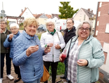
Zur Schöpfungsandacht im Oktober war in St. Hippolyt eingeladen – mit einem kleinen Umtrunk danach...